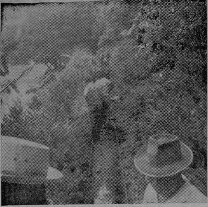
Esta es la línea férrea del burocarril de Chirripó. Flota sobre las aguas del río lo que es un gran peligro de que los cientos de moradores de esta zona queden aislados en las próximas llenas que, como habitual produce inundaciones. Los vecinos piden una garantía cuyo único medio es la construcción de un camino de penetración.